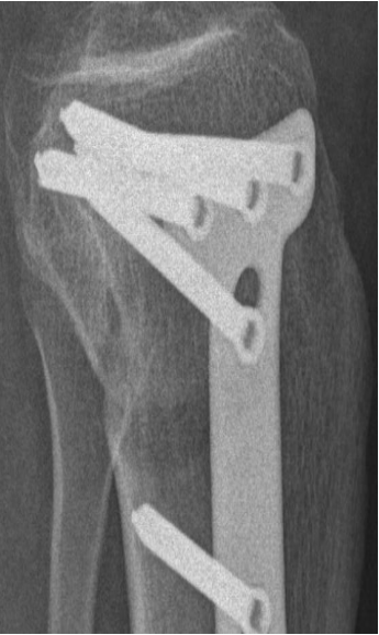
Aufnahmen 6 Wochen post OP , Vollbelastung, Patient beschwerdefrei