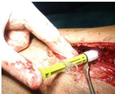
Auffüllung der Defektspalte mit 15 ml NanoBone