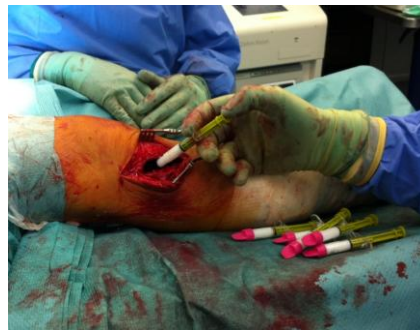
Defektauffüllung mit 50 ml NanoBone putty